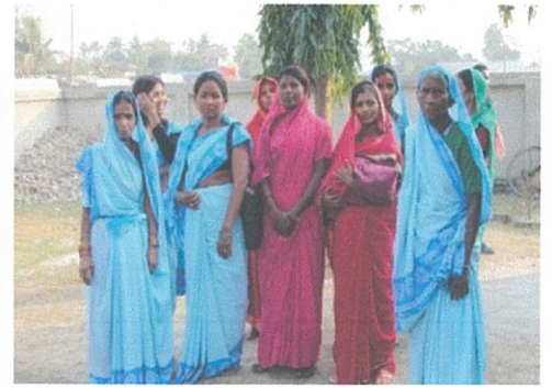
ヘルスボランティア (出生後の赤ちゃんの検診も行い 肺炎の予防をする)