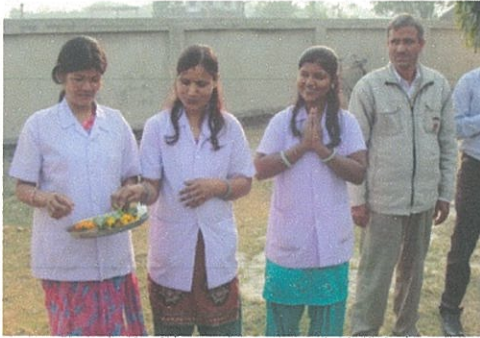
出産センターの助産師 (赤ちゃんとお母さんの強い味方)

産手当などが支給されます。その結果、妊産婦の健康ばかりではなく、子どもの生存・教育の可能性につながっていきます。このセンターの設備はまだ十分とは言えませんが、彼女たちの姿にネパールの女性と子どもたちの未来へつながっていくものを確信しました。