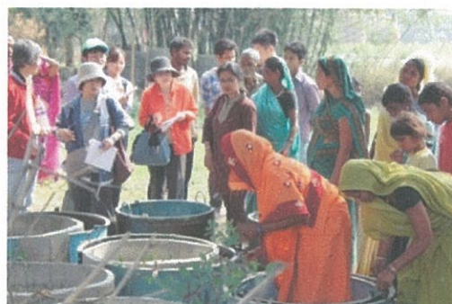
トイレ用リング作り (女性が作り、トイレも組み立てる)