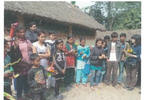
労働児童子ども会のメンバー

ユニセフのこのプログラムが成功したことにより、ネパール全土に、政府レベルでの『子供にやさしい地方自治』の取り組みに移行され始めています。生協の支援によるユニセフの DACAW の成果がネパールの全域に見られることがそう遠くはないと感じました。