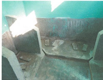
バダスワリ小学校 (ユニセフの支援のトイレ 男女別に設置してある)