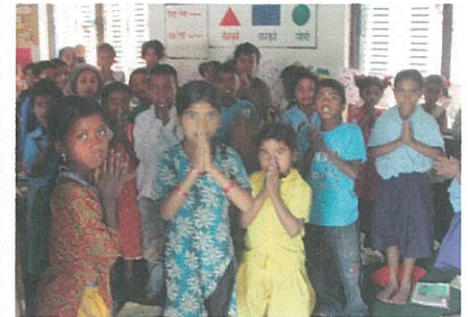
(低学年のクラス・英語教育も実施 教室が足りないので2部制も)