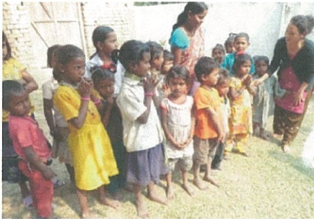
早期幼児開発センター (歌と踊りで歓迎してくれた)

女性は日雇をしています。貯蓄という知識はなかったが、女性の会を作り、貯蓄をし、そこから必要な人に融資し、生活が改善されるようになりました。このように DACAW のプログラムは地域住民が自ら状況を把握し、積極的に係ってもらい改善していく方策をとっていることが伺えました。