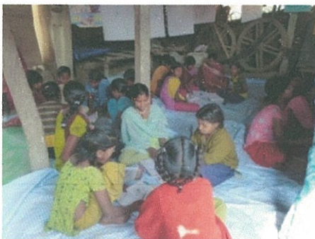
非公式授業(GATE)の様子 (10~18歳の女子)ネパール語、英語 算数の墓ライフスキルズも教わる)

この活動で女性たちはトイレのリングづくりを習得し、仕事とし、前よりも高額な収入を得るようになりました。また、ユニセフの支援で、村に集会所を女性のボランティアの手で建設しています。